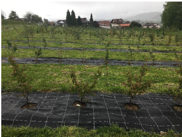
Blick auf Felsenbirnen, Berberitze und Sanddorn

Auch im Wildobst-Arboretum gibt es Auslesen von diversen Sorten. Man findet dort Sorten von Mispeln, Haselnüssen, Kornelkirschen, Schwarzdorn, Kirschpflaumen, Mehلبereen, Felsenbirnen, Sanddorn, Heckenkirschen, Aronia, Vogelbeeren, Ebereschen und viele mehr. Aufgeteilt sind die Gehölze in Module, welche die Arten nach deren Verwertung einteilen. Da gibt es die Mischhecke, die Naschhecke, die Einmach-Hecke und die Heilpflanzen-Hecke. Das Wildobst-Arboretum in Dürrenäsch ist frei zugänglich und es darf auch genascht, nicht jedoch geerntet werden.