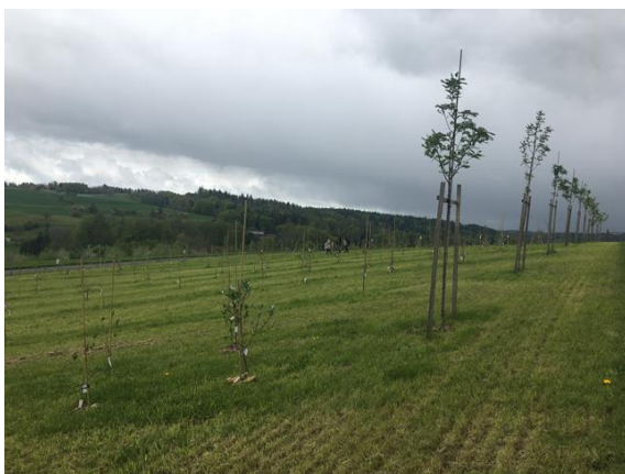
Im Wildobst-Arboretum säumen Speierlinge, Elsbeeren, Traubenkirschen und Wildkirsche die Allee.

Es gibt verschiedene Auslegungen. Als Wildobst werden meist diejenigen Wildgehölze beschrieben, deren Früchte essbar und verwertbar sind und züchterisch nicht oder kaum bearbeitet wurden. Sie wachsen ohne menschliches Zutun in der freien Natur. Es gibt mittlerweile auch Auslesen, wie Sanddorn, Kornelkirschen, Holunder und Wildrosen.