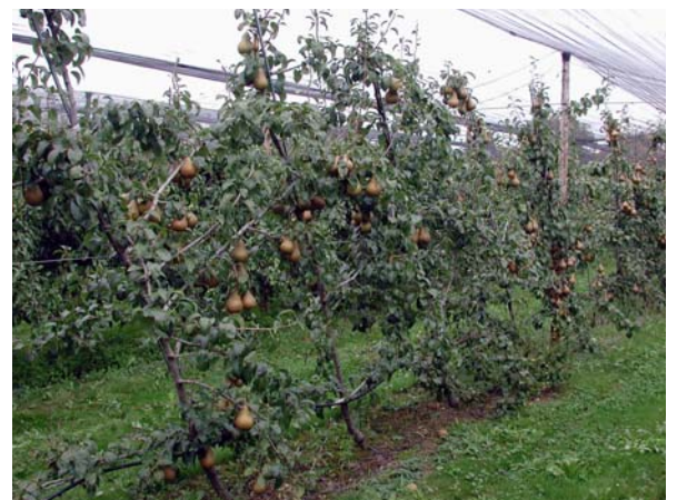
Das Drapeau Marchand System hat sich bei den Birnen gut bewährt.

Für Sorten, die Affinitätsprobleme mit Quitten aufweisen, sind Zwischenveredlungen zu verwenden. Zum Beispiel Kaiser Alexander wird mit Conférence zwischenveredelt.