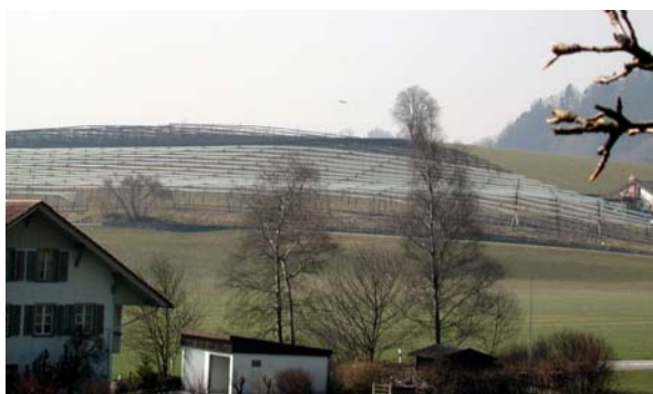
Standort, Unterlage und Sorte beeinflussen den Pflanzabstand!

Schwachwachsende: Braeburn, Gala (alle Typen), Granny Smith, Idared, Summerred, Rubens-Civini, Resi, Diwa , Honeycrunch-Honeycrisp