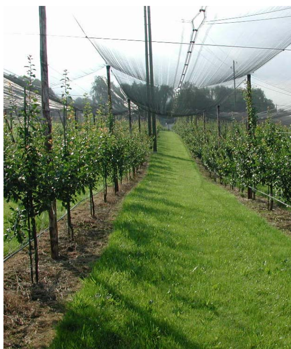
Reihenabstand: Als Faustregel gilt: Baumabstand innerhalb der Reihe und Traktorenbreite + 0.5 bis 1 m.

Die Standardvariante dient als Ausgangslage. Unter Berücksichtigung der Faktoren Standort, Unterlage und Sorte kann eine Feinabstimmung erfolgen.