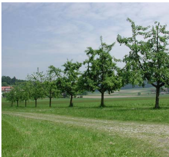
Die Grenzabstände für Hochstämme betragen im Kanton Bern drei Meter.