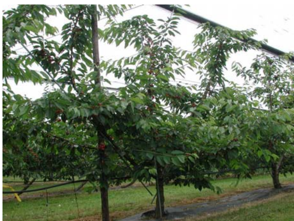
Kordia Hecke auf Maxma 4.5 x 4 m.

Beim Pflanzabstand sind die Sorteneigenschaften zu berücksichtigen: Untere Werte für schwach wachsende Sorten, obere Werte für stark wachsende Sorten. Die wichtigsten Sorten und ihre Wuchseigenschaften: