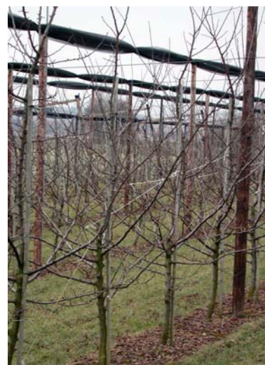
Bei den Zwetschgen wurden mit den schwachwachsenden Unterlagen mit der Spindel gute Erfahrungen gemacht. Bild: Fellenberg-Spindel auf Jaspi, 4 x 2 m. Längerfristig zu eng gepflanzt.

Schwachwachsende Sorten: Berudge , Damassine , Grüne Reineclaude , Fellenberg , Cacaks Fruchtbare , Cacaks Schöne , Ersinger