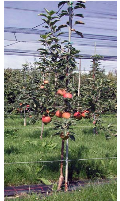
Hauptanbauform ist nach wie vor die Spindel.